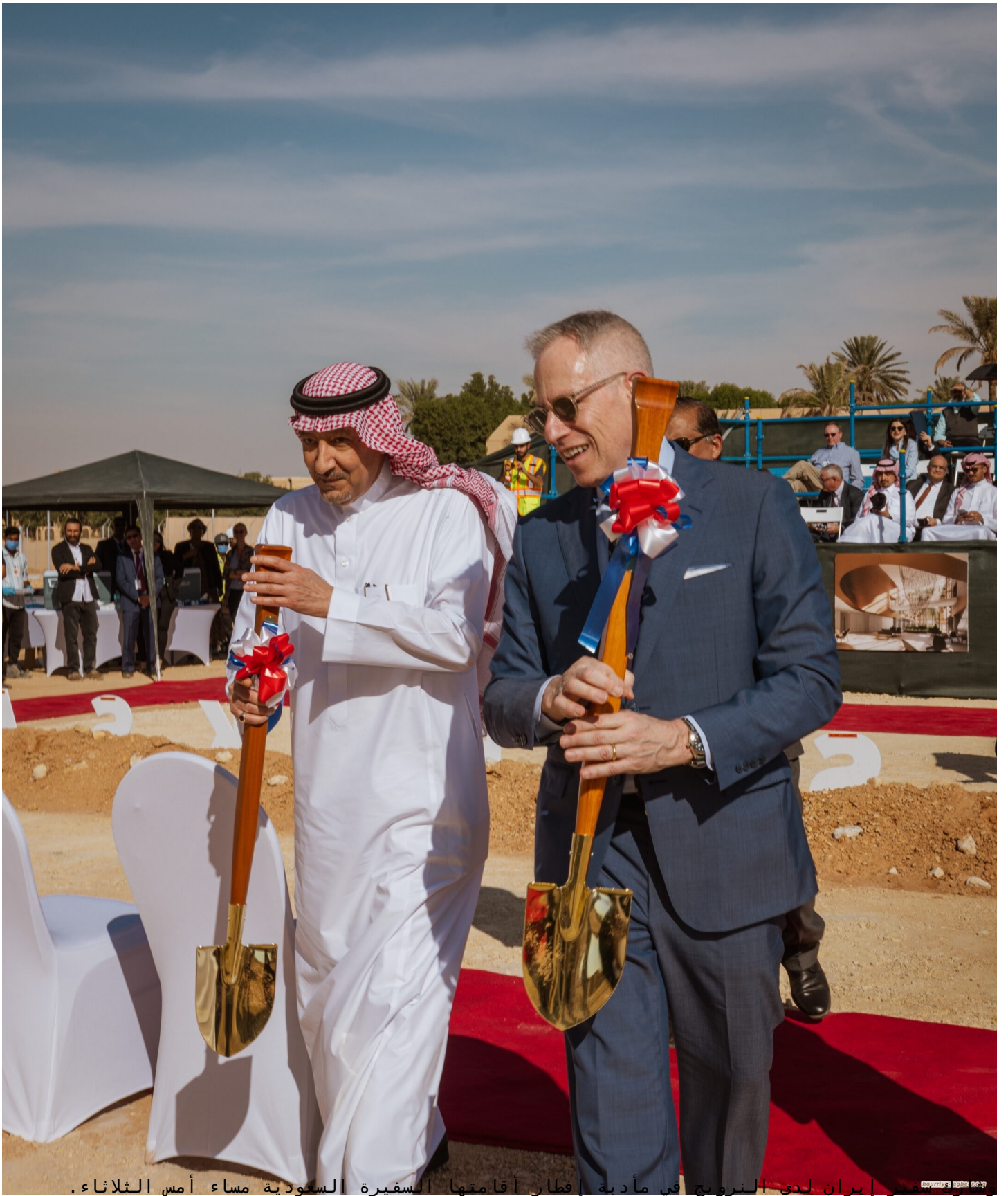
وزير إيران لدى النرويج في مأدبة إفتار أقامتها السفارة السعودية مساء أمس الثلاثاء.